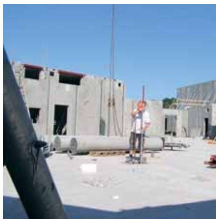
Ørstedskolen, superskole til 1000 elever, Langeland