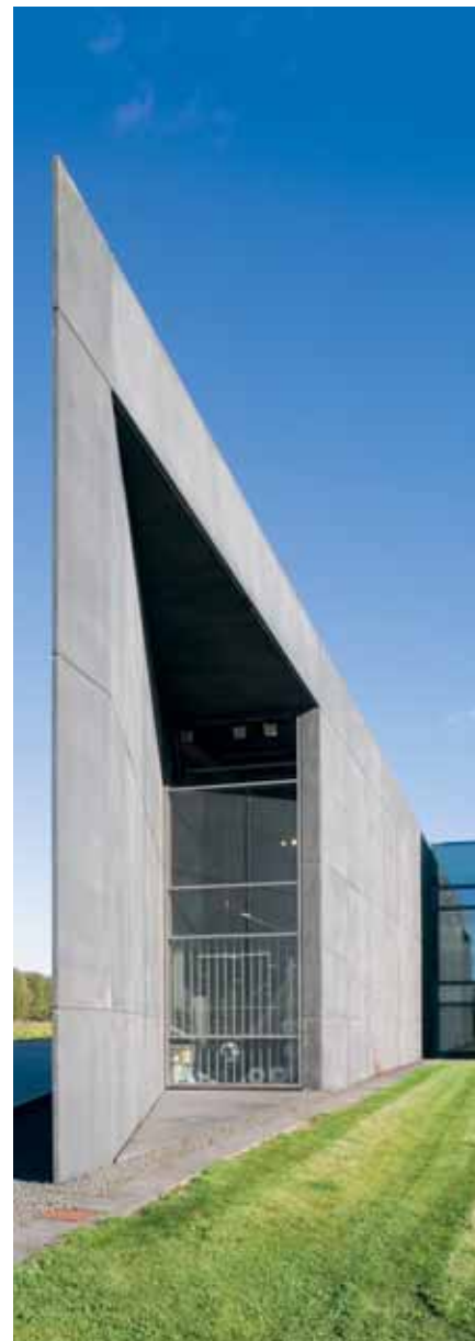
Idé Møbler, Århus