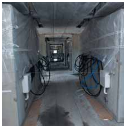
Forseglet og færdigmonteret