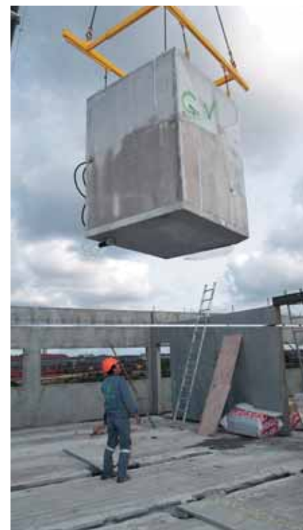
Det færdige badeværelse leveres på byggepladsen