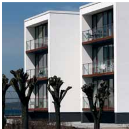
Havnefronten - 30 eksklusive lejligheder fordelt på 5 punkthuse, Middelfart