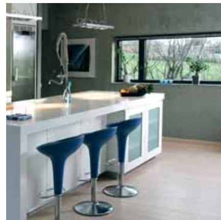
Rå betonmur indvendig - en populær og trendy løsning