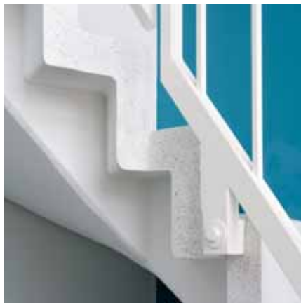
Bollger, Holbæk Kaserne

Dalton leverede trapper til det prisbelønnende og enestående boligbyggeri VM Husene i Ørestaden. Husene er skabt af arkitekterne Bjarke Ingels og Julien De Smedt. Byggeriet fik Forumprisen 2005 som Nordens bedste bygningsværk/indretning.