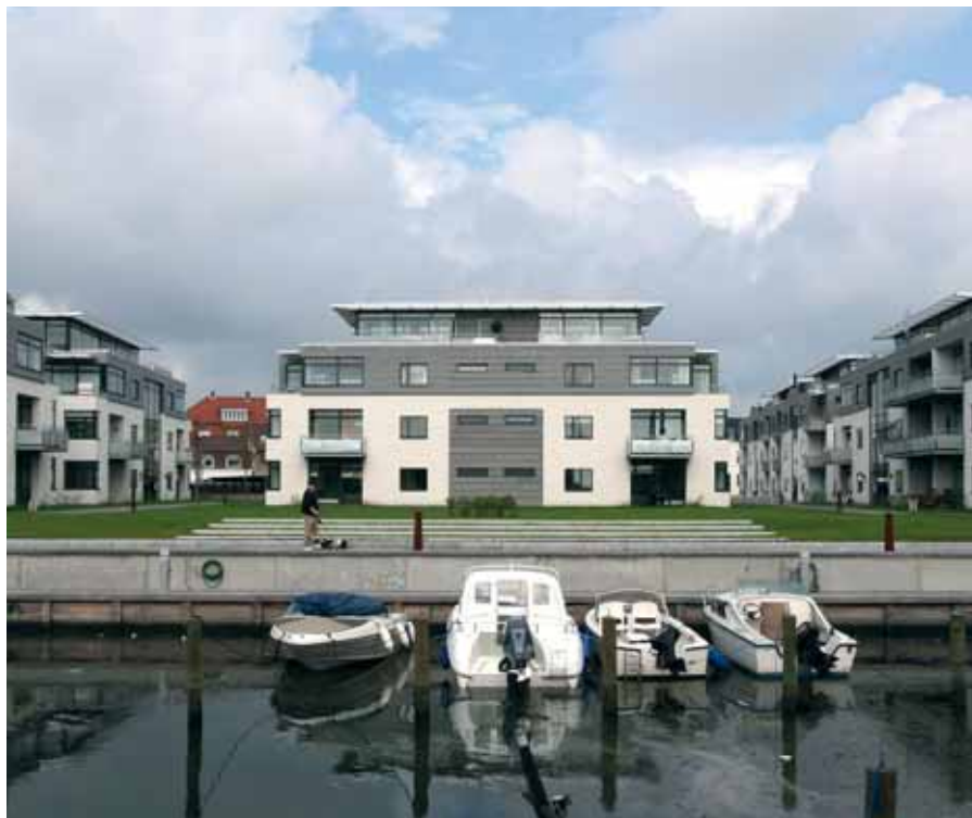
Svansøparken -30 eksklusive boliger, Nyborg

Byg op til 5 etager med vores elementer i letklinkerbeton